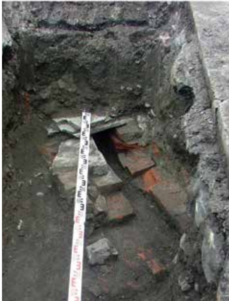
Pierwszy, odkryty kanał w ul. Bednarskiej.