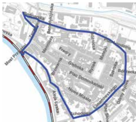
Stanowisko archeologiczne Cieszyn st. 13 (AZP 109-44/17) - obszar staromiejski w granicach średniowiecznych fortyfikacji miejskich (mur obronny i fosa miejska).

Kolejny artykuł poświęcony jest najważniejszym artefaktom* odkrytym podczas robót budowlanych związanych z modernizacją kanalizacji w śródmieściu naszego miasta.