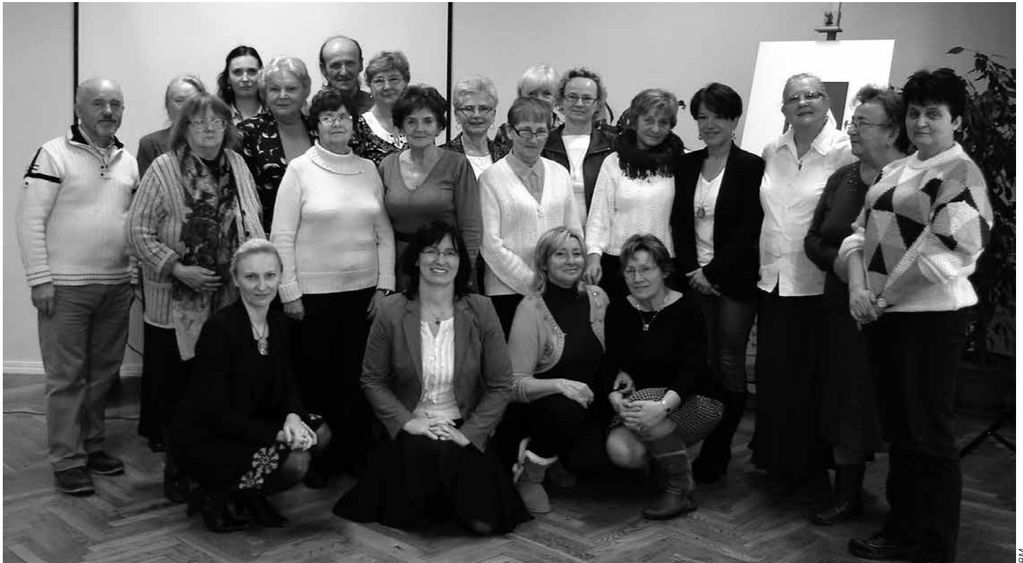
Pamiątkowe zdjęcie uczestników kursu komputerowego w Bibliotece Miejskiej.