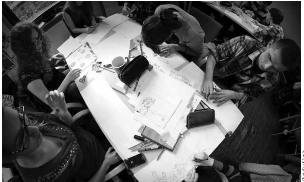
Mikstura.IT przygotowała warsztaty projektowania gier.

Co roku w listopadzie, aż w 139 krajach, organizowane są najróżniejsze przedsięwzięcia pod wspólnym szyldem: Światowego Tygodnia Przedsiębiorczości. Celem tej inicjatywy jest wspieranie i tworzenie klimatu do kształtowania postaw przedsiębiorczych.