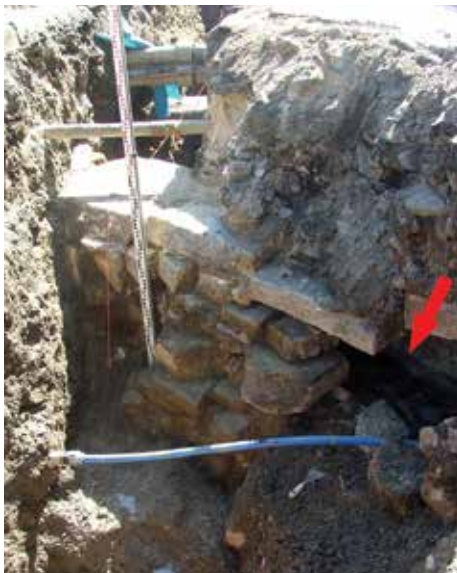
Strzałka wskazuje drugi, odkryty kanał w ul. Bednarskiej.