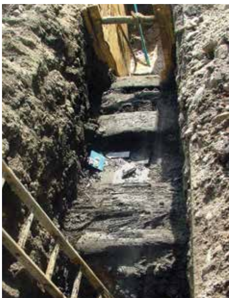
Drewniana konstrukcja odkryta w ul. Bednarskiej.