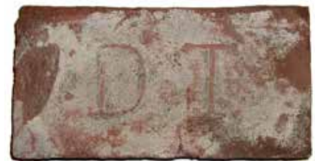
Cegła wydobyta z kanału w ul. Bednarskiej.

W trakcie prowadzenia robót kanalizacyjnych w ul. Bednarskiej natrafiono na dwa nieczynne kanały oraz drewnianą konstrukcję. Kanały przykryte były płaskimi kamieniami. Ich wiek został określony