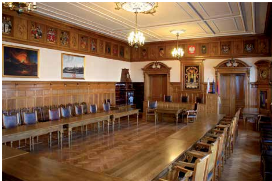
Sala posiedzeń Rady Miejskiej powstała w 1906 r. Ozdobiona jest bogatą boazerią i herbowym fryzem z godłami cieszyńskiej szlachty i cechów rzemieślniczych.