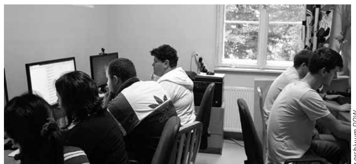
W uruchomionej w ramach projektu pracowni rozwijano swoje zainteresowania komputerami i poligrafią.

Grudniowa konferencja naukowa organizowana w ramach akcji edukacyjno-promocyjnej „Nasza Wspólna Sprawa” będzie podsumo-