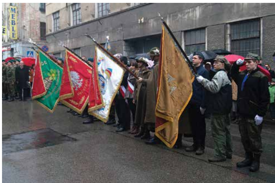
Podczas uroczystości obecna była Kompania Honorowa oraz poczty sztandarowe.