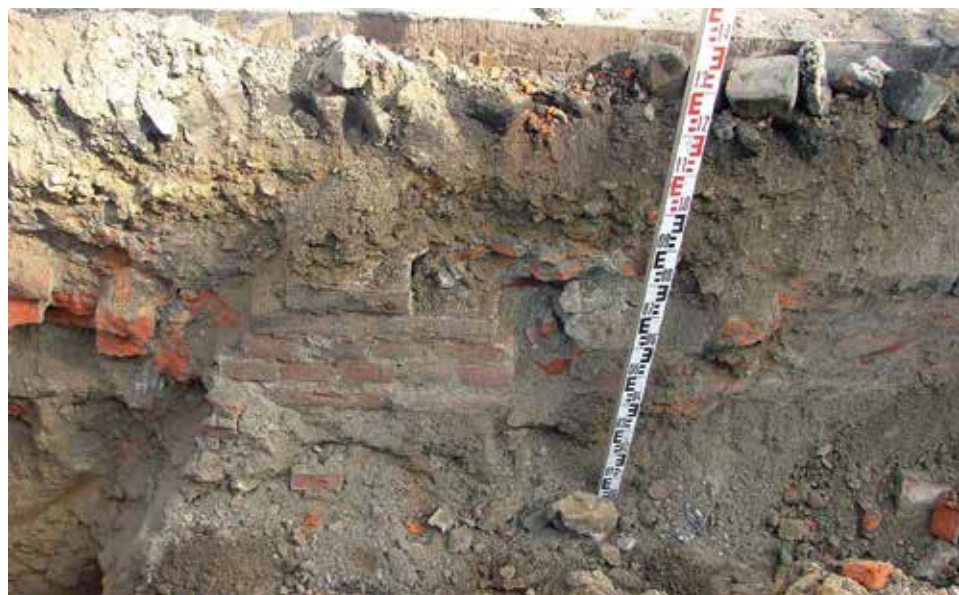
Murowana konstrukcja odkryta w Placu Londzina.