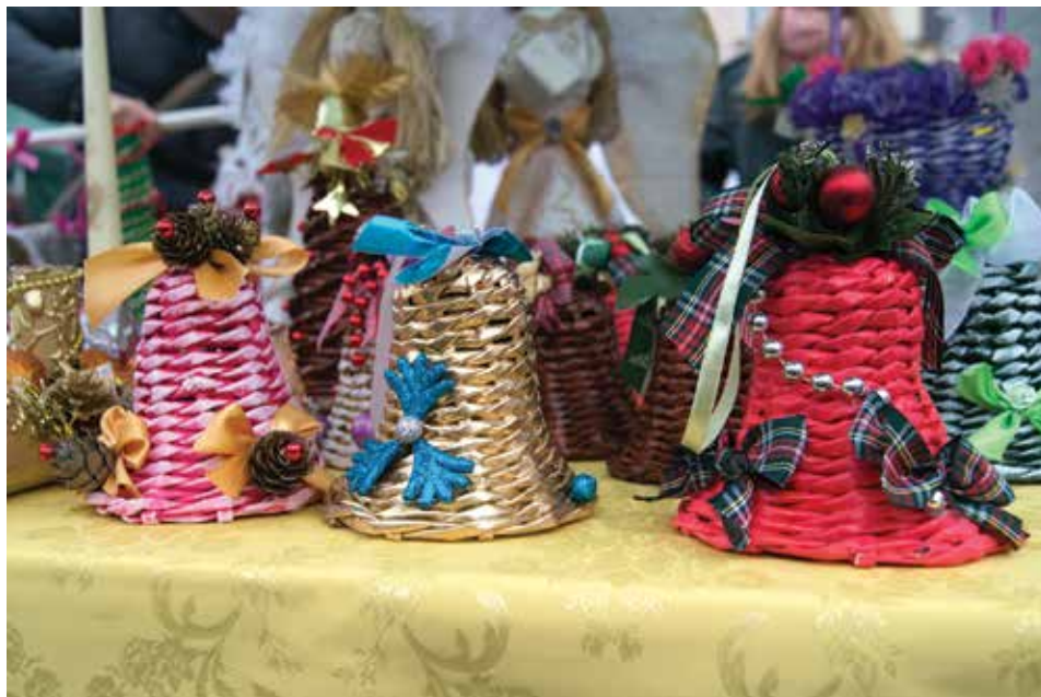
Na jarmarku królowały świąteczne ozdoby, dekoracje stroiki, a także biżuteria artystyczna czy ręcznie szyte maskotki.