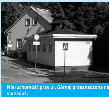
Nieruchomość przy ul. Górnej przeznaczona na sprzedaż.

Sprzedaż jest zwolniona z podatku VAT na podstawie art. 43 ust. 1 pkt 10a w związku z art.